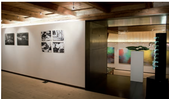
“benachbART” stäfART zu Gast in der Kulturschüür Liebegg