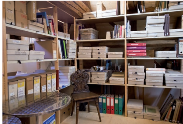
Archiv in der Kulturschüür Liebegg

Unser Archiv umfasst eine riesige Anzahl von Büchern, Broschüren, Dokumenten, Bildern, Fotos und Zeitungsausschnitten zur Geschichte Männedorfs und der Schifffahrt auf dem Zürichsee. Archiv und Fundus sind digital erfasst und stehen interessierten Kreisen zur Verfügung. Der Zugang erfolgt über unsere Homepage www.kulturschuer.ch