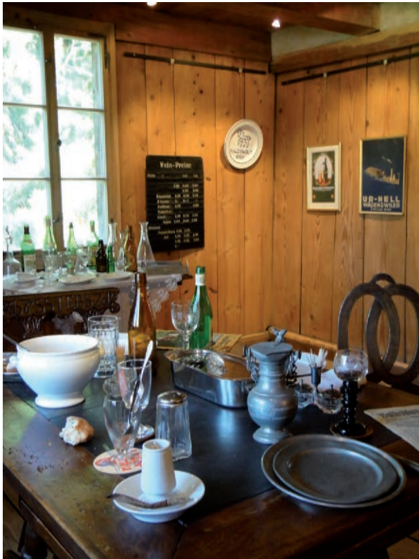
Ausstellung "De Leue und anderi Beize"

Jedes Jahr gestalten wir eine eigene Ausstellung in der lokale, regionale oder Themen aus der Zürichsee-Schifffahrt zum Zuge kommen. Basis ist unsere an zwei externen Orten gelagerte ortsgeschichtliche Sammlung und das Archiv.