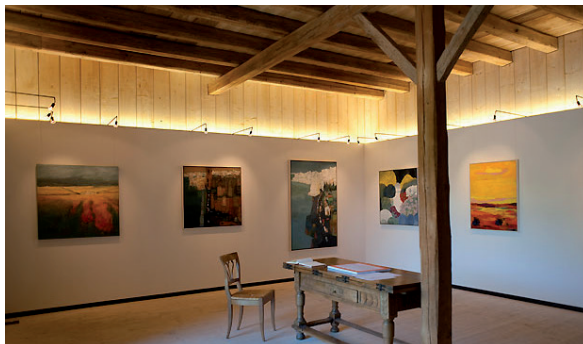
“Die Unjurierte” mit 41 Männedörfler Kunstschaffenden